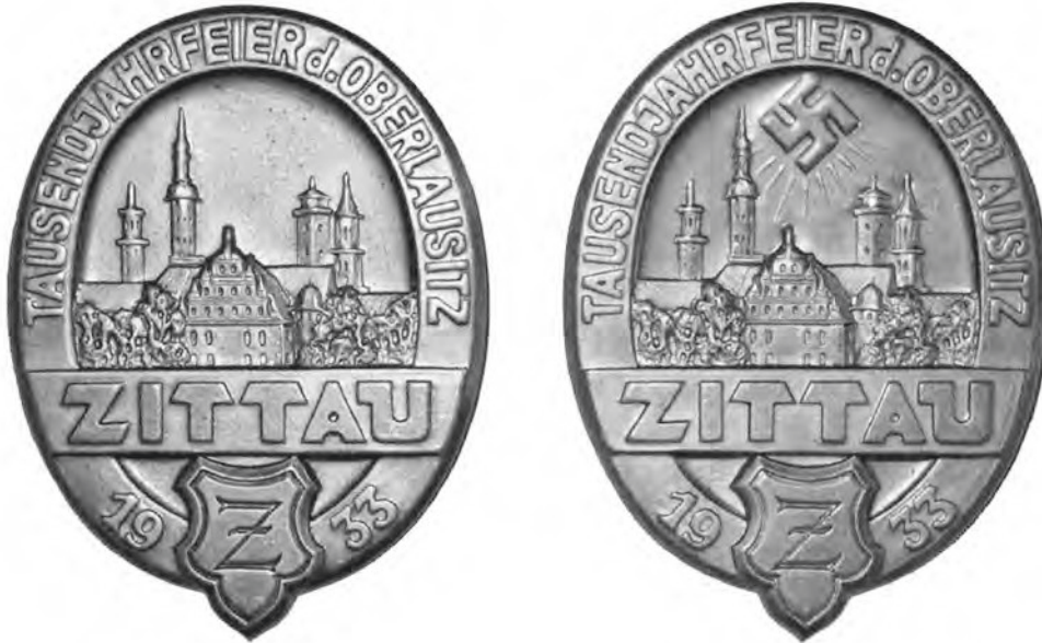
Blechplaketten mit Anstecknadel, gestanzt, oval 51×41 mm (Stadtmuseum Zittau, ohne Hakenkreuz: Inv.-Nr. 25719, mit Hakenkreuz: Inv.-Nr. 25720).