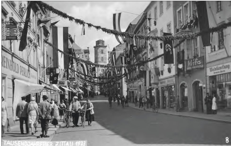
Postkarte zur Tausendjahrfeier in Zittau